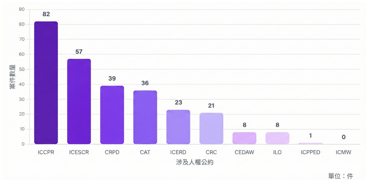
圖 2 NHRC 受理陳情申訴案件中所涉及人權公約 7