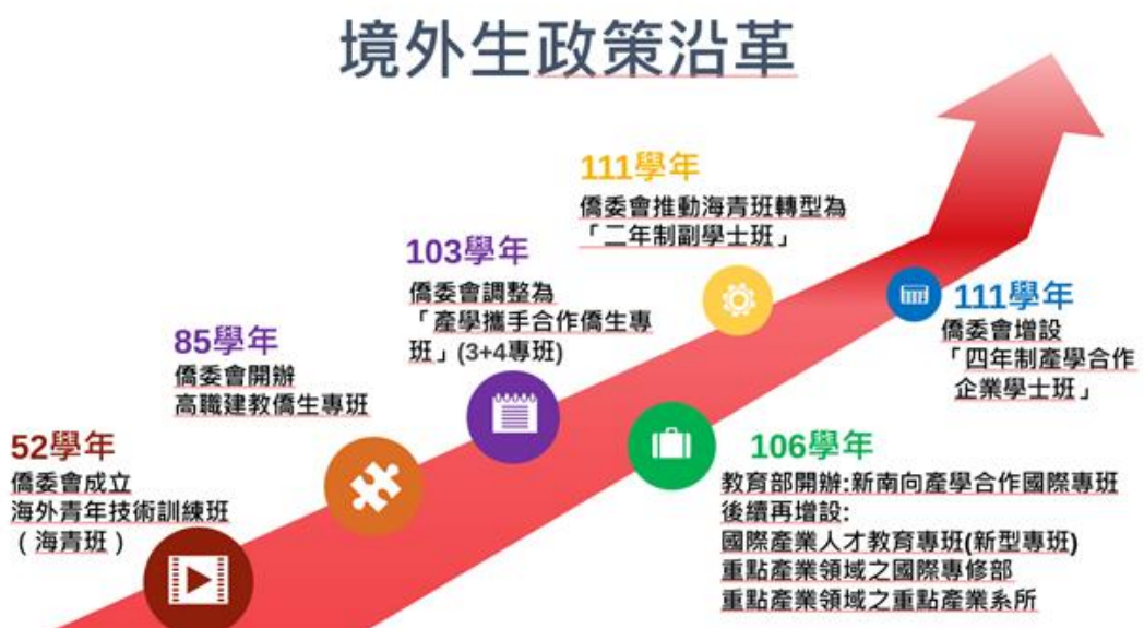
圖1：我國境外生政策沿革