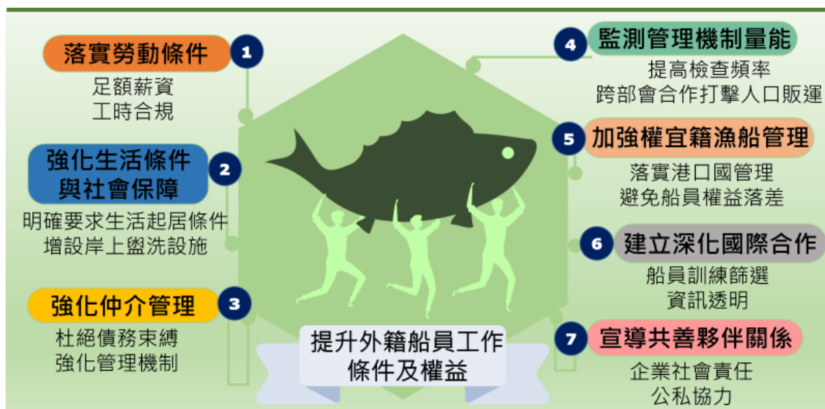
圖：漁業與人權行動計畫七大策略（漁業署）

在漁業與人權行動計畫的撰擬過程中，漁業署彙整相關部會、民間團體以及產業團體的意見，也參考國際公約的相關規範，提出七大策略，每一個策略之下均定有具體的目標。